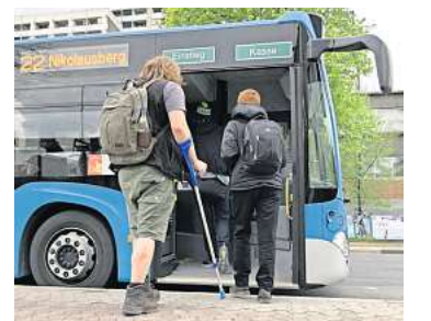
Das Semesterticket gilt als 9-Euro-Ticket – und wird deshalb günstiger.

Doch bei diesem Vorgehen fällt eine große Gruppe Studierender durch das Raster: Alle, die in diesem Sommersemester ihr Studium beenden und im Wintersemester nicht mehr an der Georgia Augusta immatrikuliert sind. Hier sei die Lösung nach wie vor nicht endgültig gefunden, so Schneider. Das wahrscheinlichste Szenario sei, dass Betroffene schließlich eine Rückerstattung beantragen können. ytk