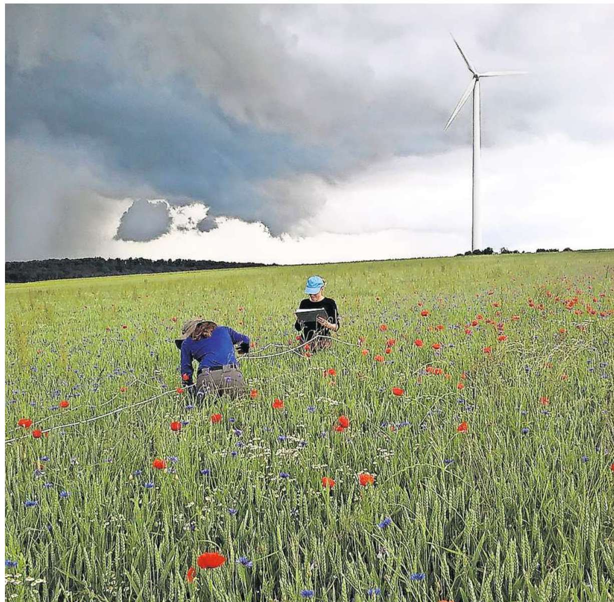
Studentinnen auf einem Bioweizenfeld bei Bodensee im Landkreis Göttingen.

Tschardtkes und Batárys Fazit wiederum ist nicht endgültig: Berechnet man den Ertragsverlust ein, den Öko-Landbau mit sich bringt, scheinen Blühstreifen wiederum